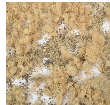
> Пример отходов

Инсталмек разработала всецело инновационный сепаратор волокна, среди преимуществ которого – гораздо меньшее потребление энергии и более высокая эффективность сортировки, по сравнению с традиционными системами на рынке. Принцип его работы основан на флюидизированной и однородной загрузке волокна, благодаря специальным валкам, а далее, на скорости флюидизации, полученной в круглой камере флюидизации, в которой встречный воздушный поток отделяет посторонние тела. Этот противоположный поток воздуха производит «сухое очищение» и, в то же время, доставляет очищенное волокно в инновационный циклон разгрузки.